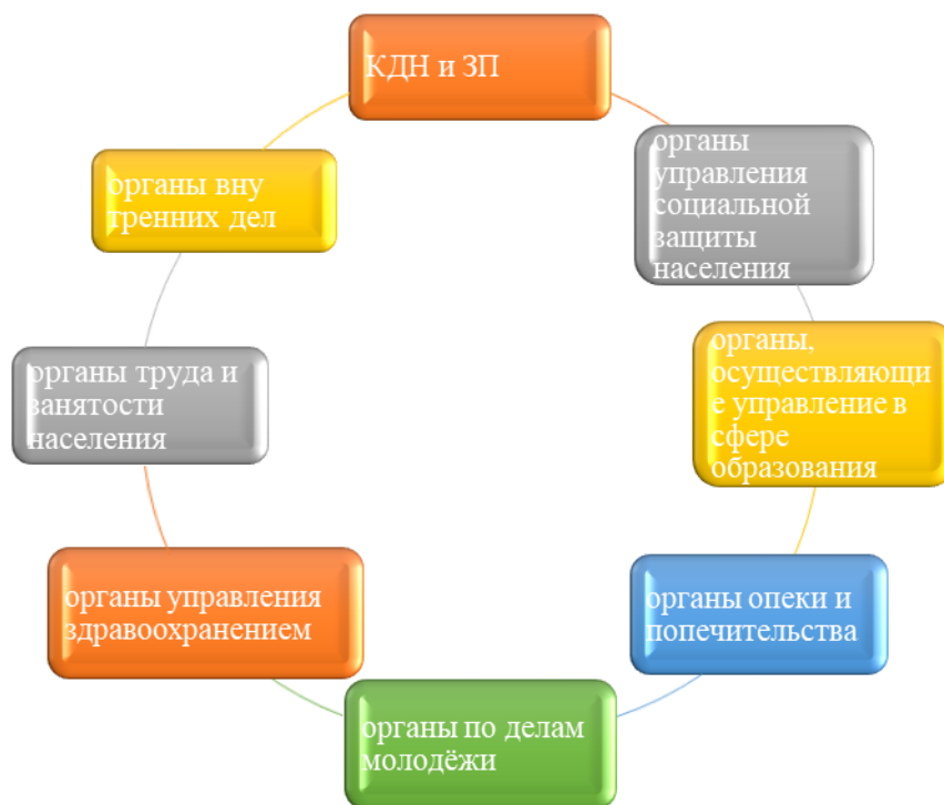
Рисунок 2. - Взаимодействие АНПОО «Кубанский техникум социального развития» с органами системы профилактики безнадзорности и правонарушений несовершеннолетних

Профилактическая работа в техникуме велась по направлениям: