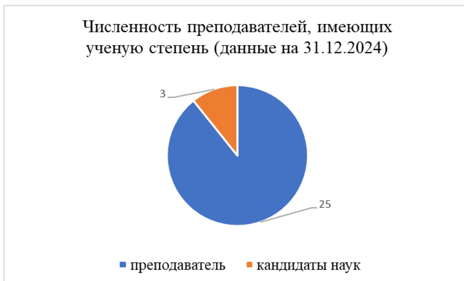
Рисунок 3 – Численность преподавателей, имеющих ученую степень, чел.

В целях повышения качества подготовки специалистов к образовательной деятельности АНПОО «Кубанский техникум социального развития» (к проведению учебных занятий и проведению промежуточной аттестации по дисциплинам, руководству практиками студентов) в 2024 году осуществляют образовательную деятельность: