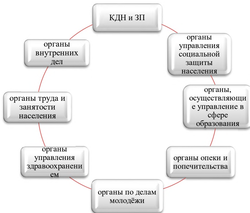
Рисунок 1 - Взаимодействие АНПОО «Кубанский техникум социального развития» органами системы профилактики безнадзорности и правонарушений несовершеннолетних обучающихся

Взаимодействие АНПОО «Кубанский техникум социального развития» органами системы профилактики безнадзорности и правонарушений несовершеннолетних обучающихся представлено на рисунке 1.