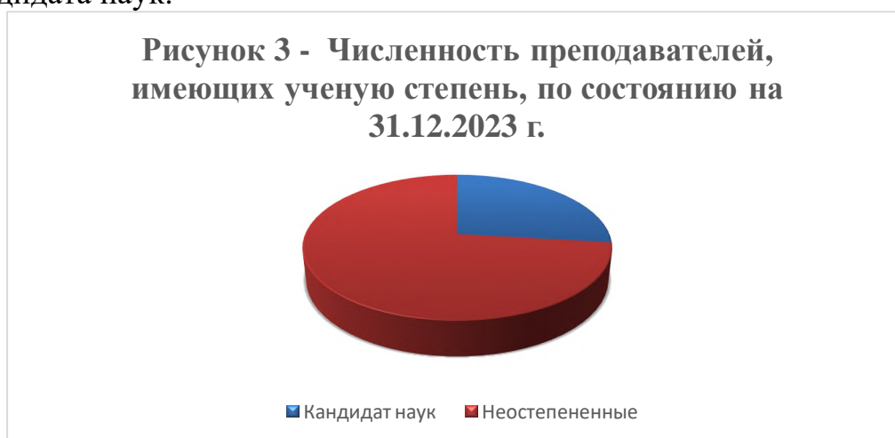
Рисунок 3 - Численность преподавателей, имеющих ученую степень, по состоянию на 31.12.2023 г.

В целях повышения качества подготовки специалистов к образовательной деятельности АНПОО «Кубанский техникум социального развития» (к проведению учебных занятий и проведению промежуточной аттестации по дисциплинам, руководству практиками студентов) в 2023 году осуществляют образовательную деятельность 2 работника из числа