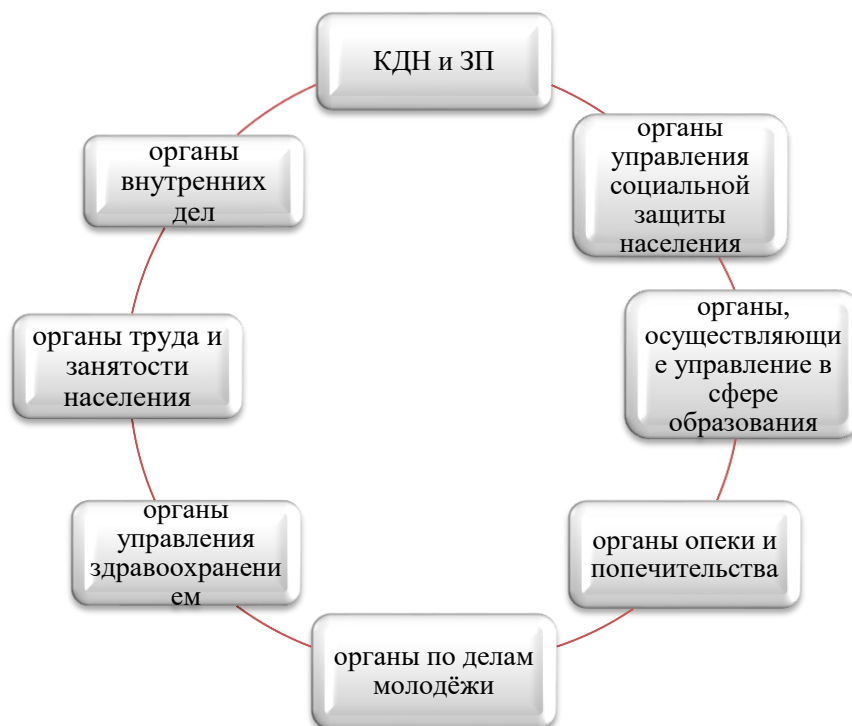
Рисунок 1 - Взаимодействие АНПОО «Кубанский техникум социального развития» органами системы профилактики безнадзорности и правонарушений несовершеннолетних обучающихся

Взаимодействие АНПОО «Кубанский техникум социального развития» органами системы профилактики безнадзорности и правонарушений несовершеннолетних обучающихся представлено на рисунке 1.