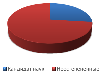
Рисунок 3 - Численность преподавателей, имеющих ученую степень, по состоянию на 31.12.2022 г.

Образовательный процесс в АНПОО «Кубанский техникум социального развития» в 2022 году обеспечивали: 12 преподавателей, в т.ч. 2 кандидата наук.